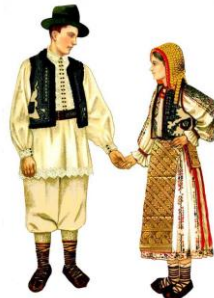
Costume Populaire Românesse, [E] Région de BANAT Zone TIMIS (sans Timokul)